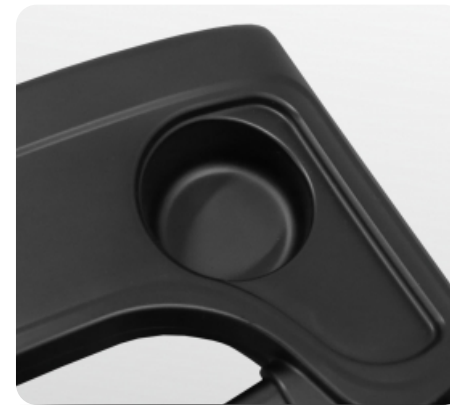
Подставка под бутылочку с водой