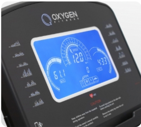
7 дюймовый (17,5 см) голубой многофункциональный LCD дисплей