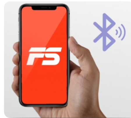
Синхронизация оборудования с мобильным приложением FitShow