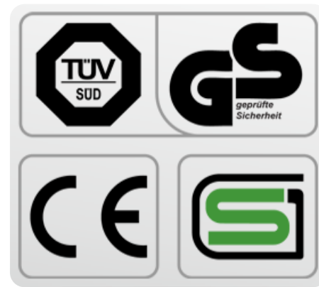
Обязательные сертификаты: европейский CE, немецкий GS TÜV, японский SG