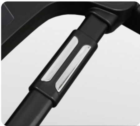
Сенсорные датчики пульса