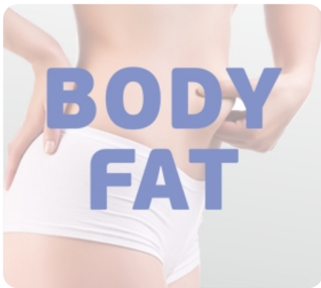
Режим жиранализатора Body Fat для определения комплекции организма