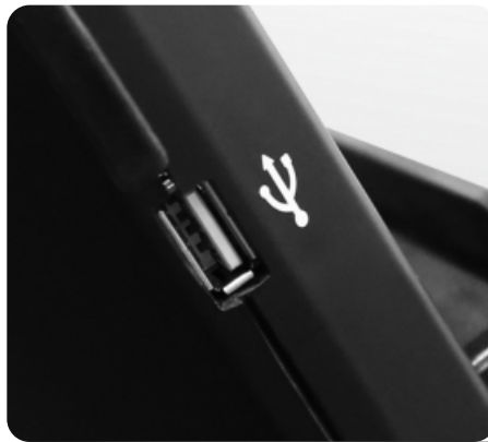
Воспроизведение аудио при помощи USB и AUX