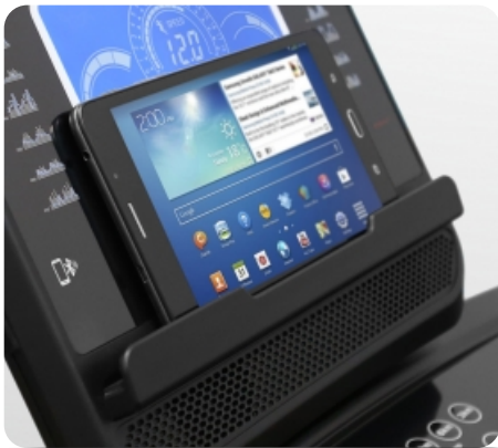
Подставка для гаджетов