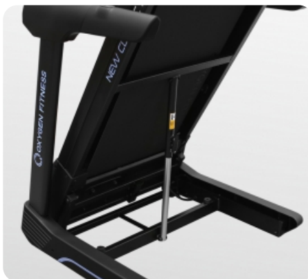
Легкое складывание за счет двухфазной гидравлики easyFOLD™