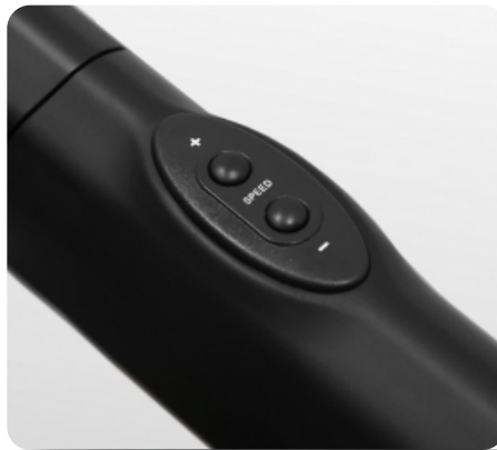
Дополнительные кнопки переключения наклона и скорости