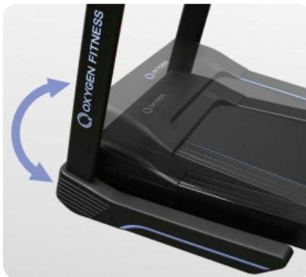
Электрически изменяемый угол наклона от 0 до 15%